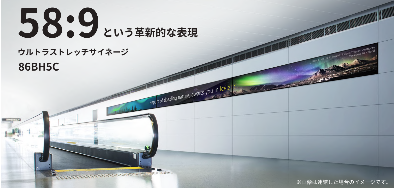
※画像は連結した場合のイメージです。